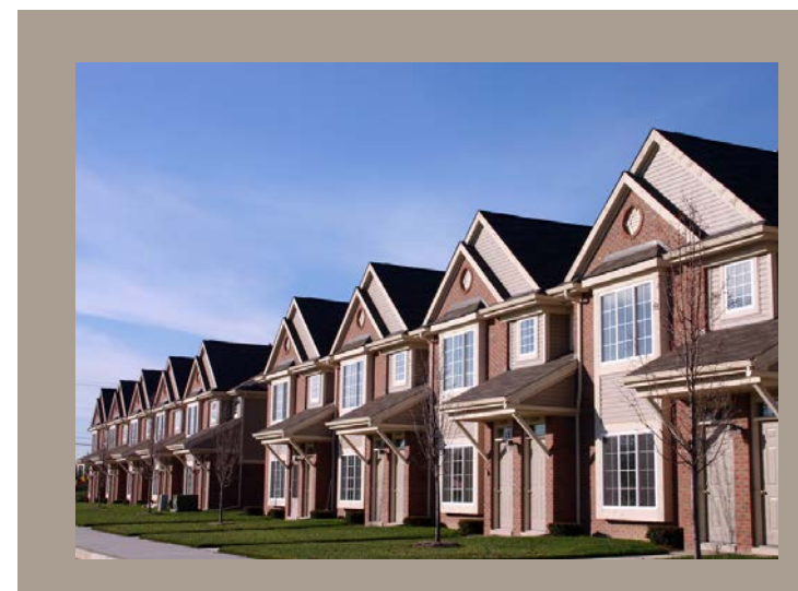
TOWNHOUSE Casa en serie